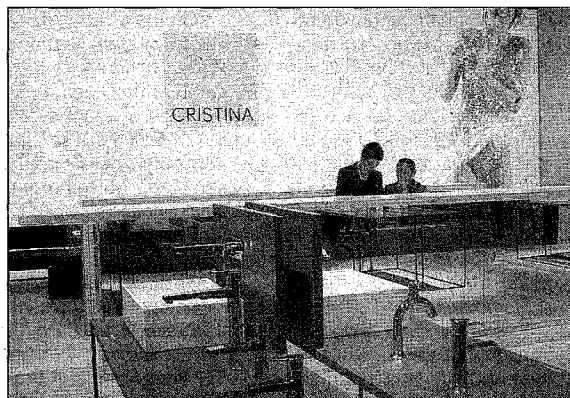
L'area espositiva della cusiana Cristina Rubinetterie