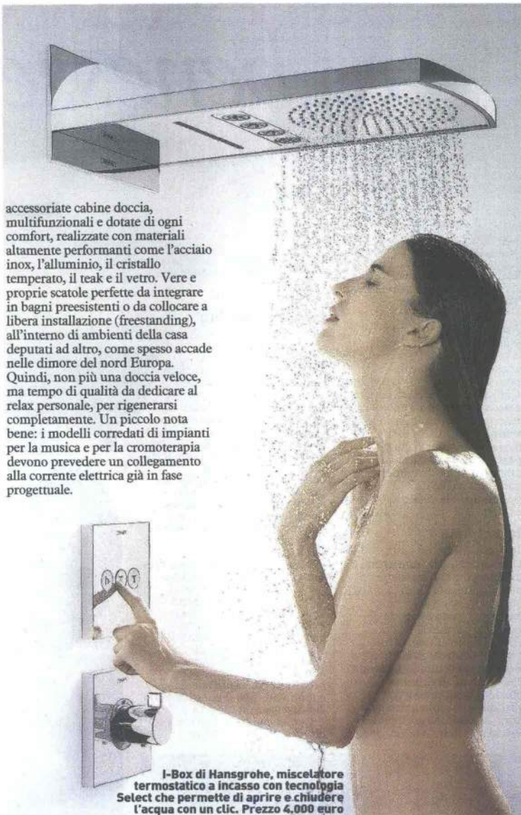
I-Box di Hansgrohe, miscelatore termostatico a incasso con tecnologia Select che permette di aprire e chiudere l'acqua con un clic. Prezzo 4.000 euro

accessoriate cabine doccia, multifunzionali e dotate di ogni comfort, realizzate con materiali altamente performanti come l'acciaio inox, l'alluminio, il cristallo temperato, il teak e il vetro. Vere e proprie scatole perfette da integrare in bagni preesistenti o da collocare a libera installazione (freestanding), all'interno di ambienti della casa deputati ad altro, come spesso accade nelle dimore del nord Europa. Quindi, non più una doccia veloce, ma tempo di qualità da dedicare al relax personale, per rigenerarsi completamente. Un piccolo nota bene: i modelli corredati di impianti per la musica e per la cromoterapia devono prevedere un collegamento alla corrente elettrica già in fase progettuale.