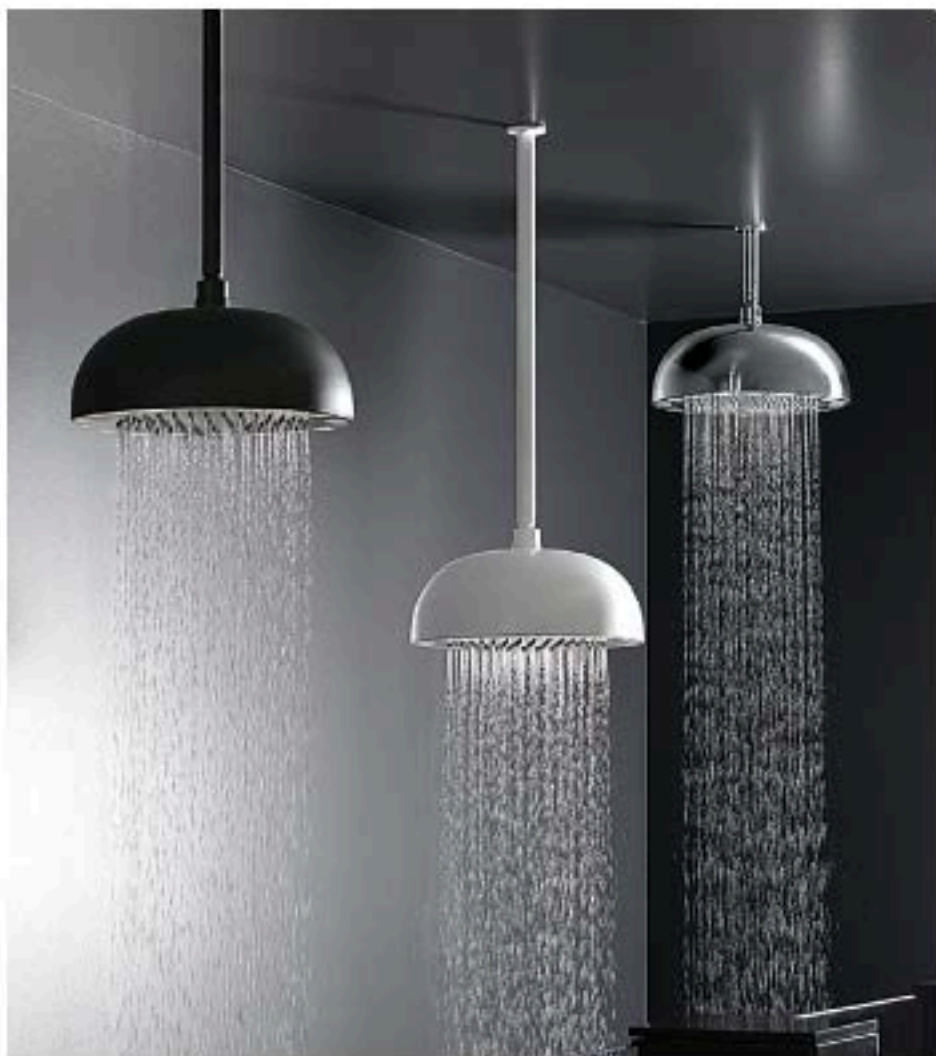
Soffioni doccia Dynamo

Un'idea tanto apprezzata da pensare di renderla ancora più bella, mediante l'utilizzo di LED colorati capaci di trasformare il rito quotidiano della doccia in qualcosa di davvero speciale, per immergersi in un'atmosfera unica e magari sfruttare anche i benefici della cromoterapia, disciplina olistica che si basa sull'impiego terapeutico dei colori. Dynamo è facile da utilizzare e da installare: non occorrono parti elettriche, può essere montato a soffione o a parete e può anche essere inserito in sistemi doccia già esistenti. Niente di più semplice. Un modello che rappresenta efficacemente le direttive seguite da Cristina Rubinetterie, che lo produce: semplicità, innovazione, design e funzionalità.